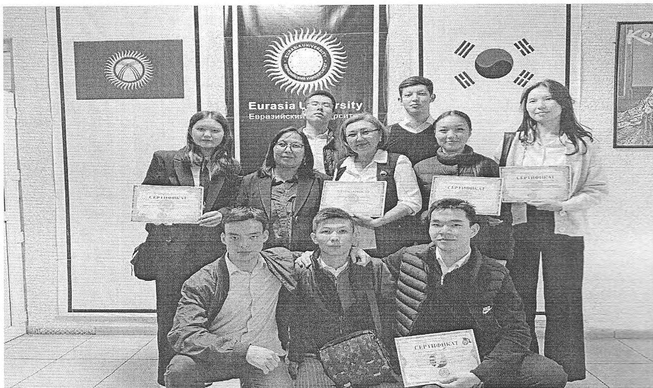
Награждение студентов сертификатами