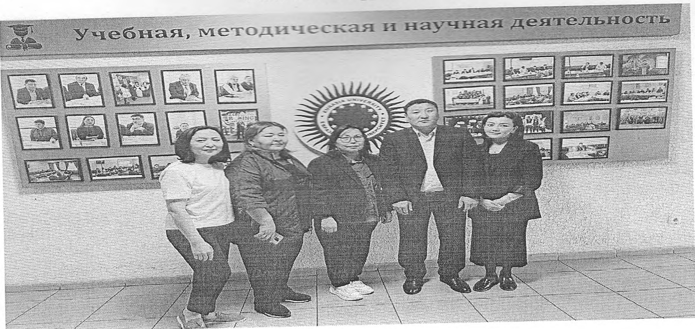
Фото отчет круглого стола