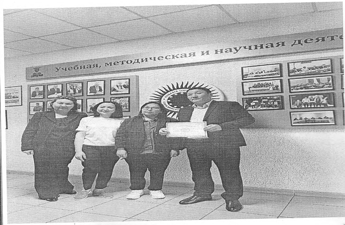
Социальные партнеры Евразийского профессионального колледжа